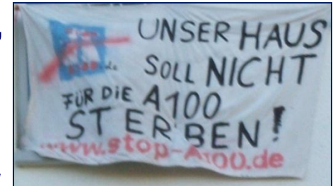
Anwohnerprotest in der Beermannstraße in Treptow

Herbst 2010: Im Abgeordnetenhaus, dem Berliner Parlament, streiten sich die Parteien in leidenschaftlichen Debatten über den Weiterbau der Autobahn A 100.