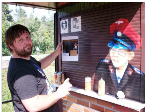
Malerarbeiten am Dienstgebäude der Berliner Parkeisenbahn (BPE)