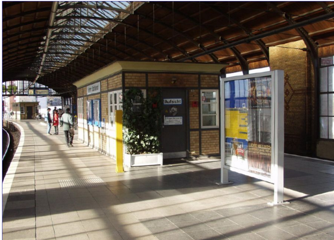
Die alte Stadtbahn