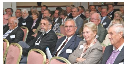
Interessierte Aufmerksamkeit bei den Teilnehmern der Festveranstaltung während der Preisverleihung und den Fachvorträgen