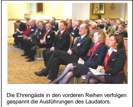
Die Ehrengäste in den vorderen Reihen verfolgen gespannt die Ausführungen des Laudators.