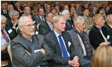
Eine aufmerksame Zuhörerschaft