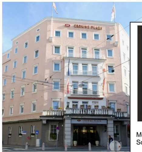
Im Schlosssaal des CROWNE PLAZA Hotels in Salzburg fand die Verleihung der „Goldenen Umweltschiene 2011“ statt