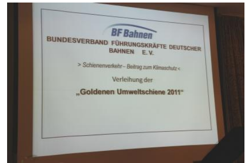
Motto der Festveranstaltung: Schienenverkehr – Beitrag zum Umweltschutz