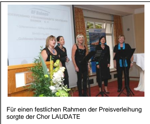
Für einen festlichen Rahmen der Preisverleihung sorgte der Chor LAUDATE