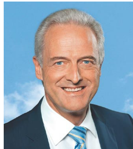
Dr. Peter Ramsauer.

Dr. Peter Ramsauer hat Ende November 2009 die Aufstellung seiner Kernmannschaft abgeschlossen und seine fünf Staatssekretäre ernannt. Sechs von neun Abteilungsleitern