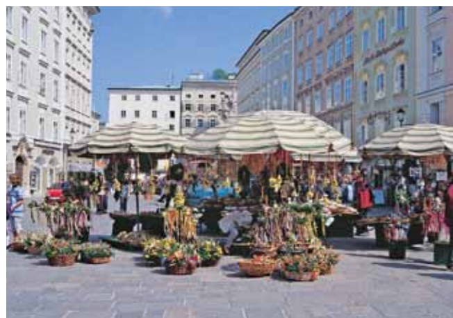
◀ In den Gassen Salzburgs lässt sich gut flanieren.

BFBahnen Bayern Fridolin Werner, Tettnanger Str. 2, 81243 München Tel.: 089/55213-433; E-Mail: bfb-bayern@t-online.de